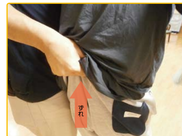
図3 持ち上げ介助でのずれ発生

介助者が介助するために加える力は外力であり、対象者の身体には圧迫とずれ力を生み、また反作用として、ずれの力、摩擦力が接触面に加わるようになります(図1 2) )。