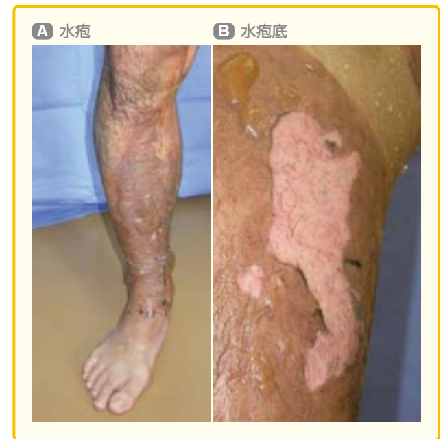
図2 20歳代男性: 高温液体による浅達性II度熱傷

A: 水疱を形成している B: 水疱底はピンク色をしており, 浅達性II度熱傷と診断される