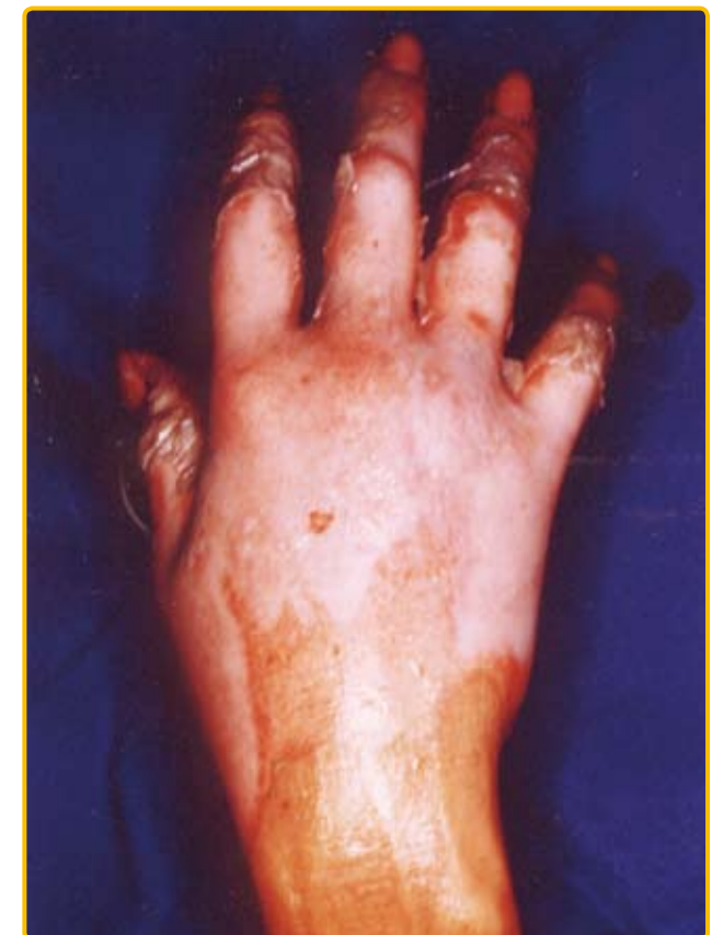
図3 50歳代女性: 高温液体 (天ぷら油) による深達性II度熱傷

これに対して, 深達性II度熱傷 (deep dermal burn; DDB, 図3) は, 真皮深層まで損傷が及んでいるために, 水疱底の真皮は蒼白色となります。浅達性II度熱傷よりは疼痛は少なく, 知覚が鈍麻してきます。治癒には, 通常3~4週間を要して, 肥厚性瘢痕を残す可能性が高くなります。