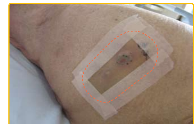
図3 めくれあがりの防止